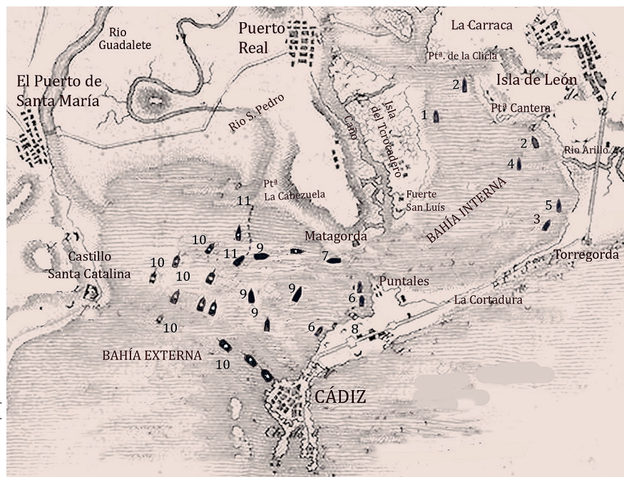
Posicionamiento de los pontones en la Bahía de Cádiz a partir del "Plan de la Baie de Cadix et L'Ile de Léon", de A. Tardieu, 1823.

de una parte, la escuadra hispano-francesa al mando del vicealmirante Villeneuve, y de otra, la armada inglesa, al mando del famoso almirante Nelson. Los navíos de línea de la escuadra francesa arribados al puerto de Cádiz: Herós , Algeciras , Plutón , Argonaute , Neptune , y la fragata Cornélié , pasaron a ser la "escuadra de Rosily" cuando pocos días después de la lucha llegó este oficial francés a esta ciudad andaluza, el conde François-Etienne de Rosily-Mesros (1748-1832).