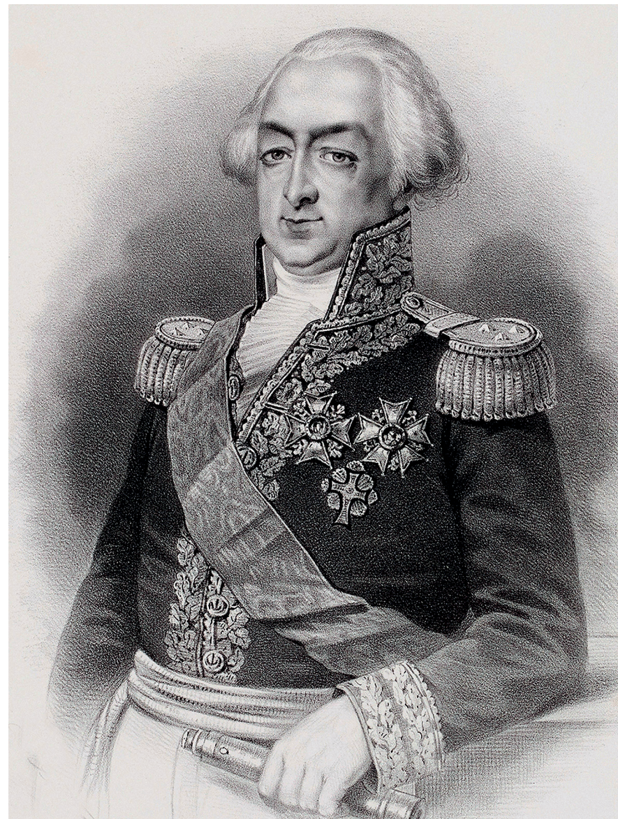
El vicealmirante François-Etienne de Rosily (1748-1832).

arqueológicamente su presencia en los barracones que habitaban.